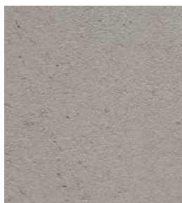
PIGMENT: Betonowy Loft

By uzyskać kolor należy zastosować pigmenty Fox Dekorator.