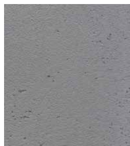
PIGMENT: Błękit Bretoński