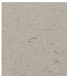
PIGMENT: Naturalny Len