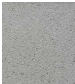
PIGMENT: Mentolowa Zielen